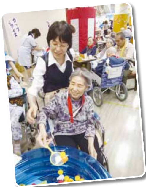
イルカ・アヒル 3匹ゲット!