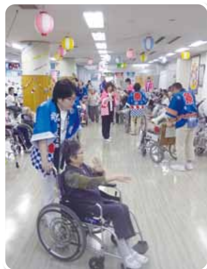
三条音頭。 まだまだ、若いもんには 負けませんよ!

くじ引きや射的では、当たっても外れても大きな歓声が上がり、利用者・ご家族共々笑顔が弾けていました。途中、利用者の方が弾くキーボードに合わせ職員が歌ったりして大盛り上がり、そしてフィナーレは民謡流しです。お馴染みの「三条音頭」を参加者全員で輪になって楽しみました。