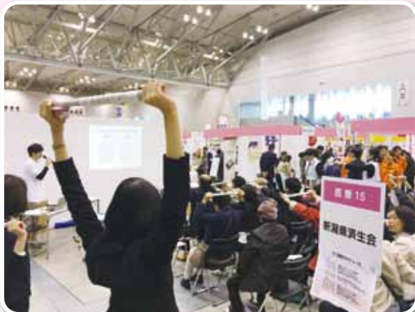
当院理学療法士による、新聞紙の棒を使った体操 (昨年の会場での一コマ)