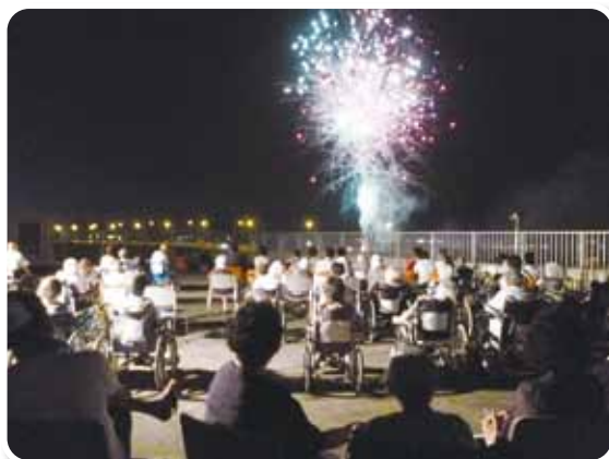
おお〜 大スターメイン!