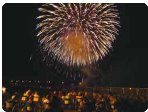
大輪の花が ドッカ〜ン!! た〜まや〜!! か〜ぎや〜!!

ご覧になった皆さんは、色とりどりのスターメインや大輪の花火を仰ぎ大満足の様子でした。