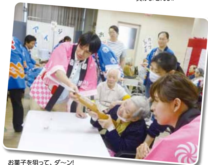
お菓子を狙って、ダ〜ン!