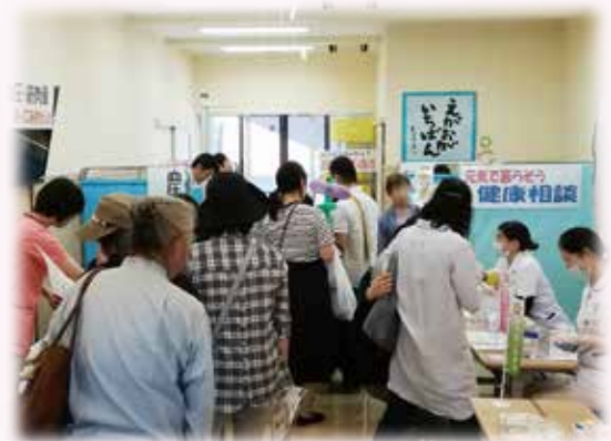
今年のおまつりの模様です