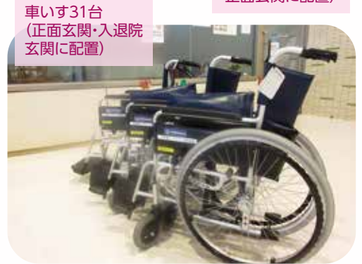
車いす31台 (正面玄関・入退院 玄関に配置)

皆様のお気持ちにお応えできますように、職員一同、これからも安心・安全で質の高い医療を提供すべく取り組んでまいります。