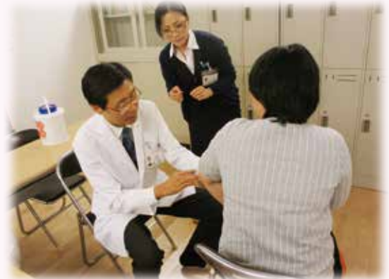
インフルエンザの予防接種を行っています

平成26年からは障がい者活動拠点施設で行われる「グッデイいきいきサポートセンターまつり」に参加しています。5回目となる今年も健康診断及び各種相談で伺い、多数の方からお出でいただきました。