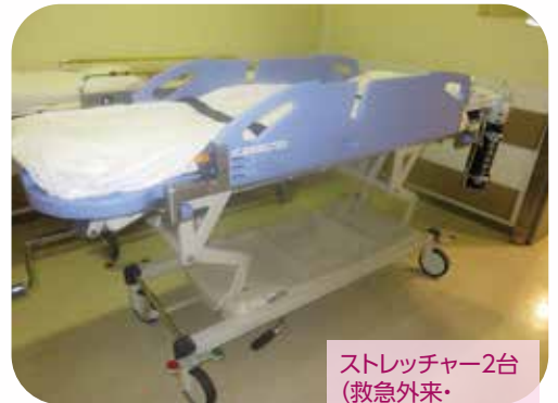
ストレッチャー2台 (救急外来・ 正面玄関に配置)

今回は様々なご支援の中から、バクマ工業株式会社様のご寄付により整備された医療機器をご紹介します。