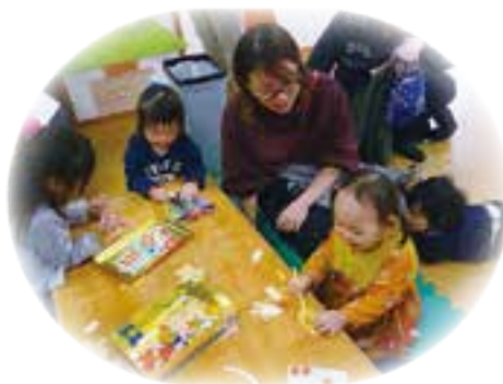
わたし色ぬりだ〜い好き!