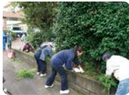
鎌で緑地の草刈り