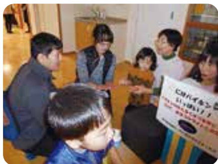
手洗いでバイキンをやっつけろ〜