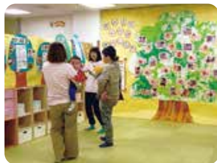
これからこんなふう成長していくんですよ