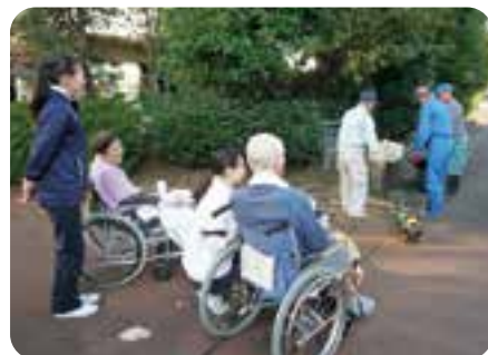
草刈り機、ありがとうございました