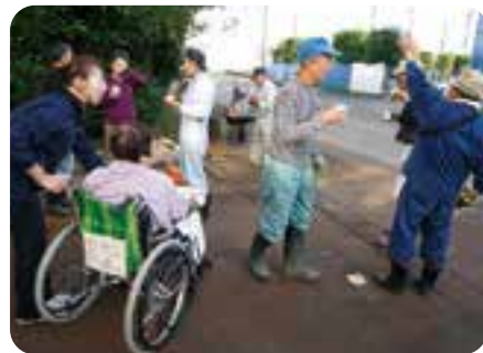
無事終了!お疲れさまでした