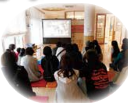
皆さん、子供さんの姿にほっこり (^_^)