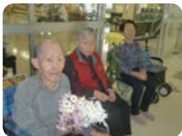
【満開の菊を楽しむ】

新型コロナウイルスの流行によって、外部からの歌や舞踊などの慰問受け入れが制限される日々が続いております。そんな中、心温まるご厚意に利用者、スタッフともに感謝いたします。