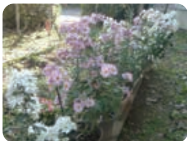
【リハビリルームから眺めるやさしい菊の花】