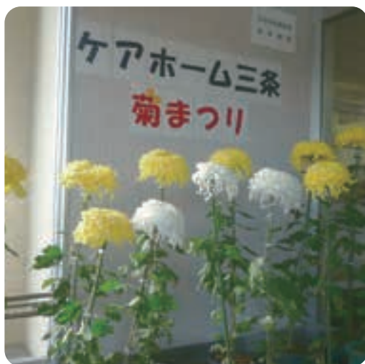
【正面玄関にて「菊まつり」】