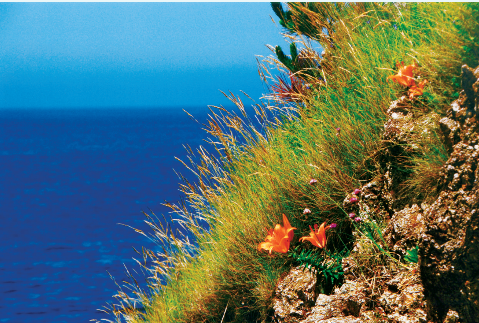
夏、海 ● 撮影 大坂鉄平氏