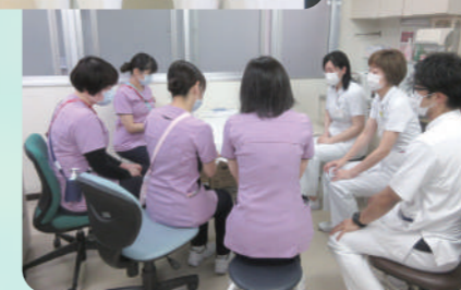
入退院支援カンファレンスの様子

医療ソーシャルワーカーとは、医療保健分野において患者さんやご家族を社会福祉の立場からサポートする福祉の専門家です。当院には社会福祉士の国家資格を持つ相談員が3名います。