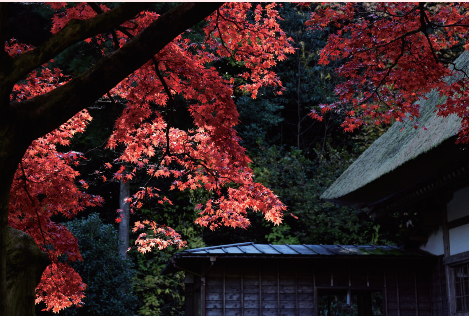
秋の彩色