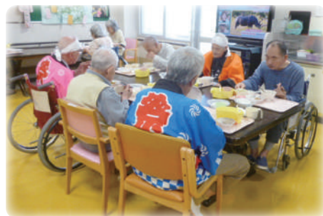
お祭り気分でランチ会