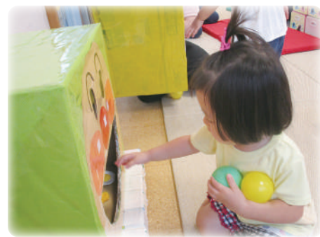
アンパンマンのお口に「えい！」

8月2日、3日、4日に各クラスで夏祭りを行いました。輪投げやボーリング、ボール入れなどのゲームを行いました。0歳児は、いつもと違う雰囲気に対し戸惑いながらも保育士と一緒に楽しみました。1歳児は、ワクワクしながら1つ1つのゲームにチャレンジしていました。2歳児は、先生が削った氷にシロップ代わりに色水をかけて、食べる真似をしていました。最後は、溶けた氷で遊んでいました。