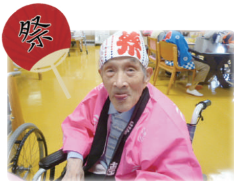
皆さん法被がお似合いです！