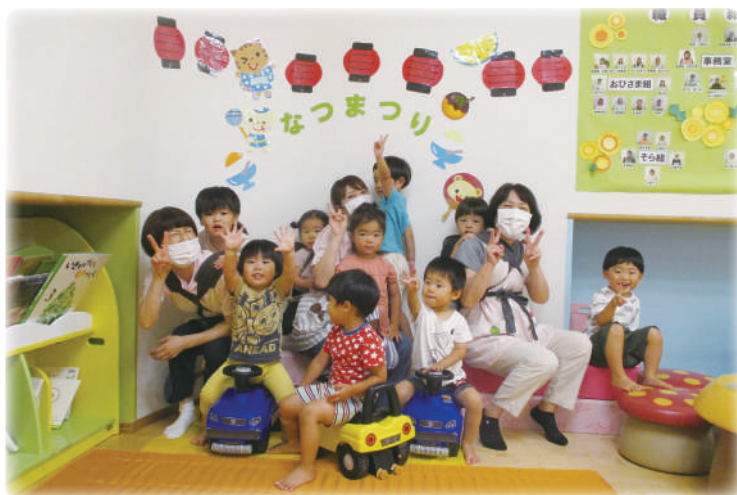
みんなでピース！楽しかったね！