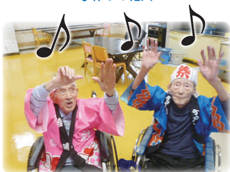
お囃子に合わせてダンス♪