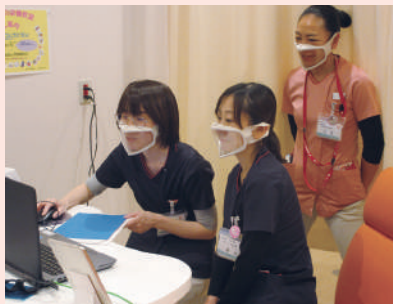
画面越しでもみなさんの真剣な様子が伝わってきました！

そこで令和3年度は、Zoom機能を使って県央地区の小中学校の皆さんに生・性教育の授業を届けました。