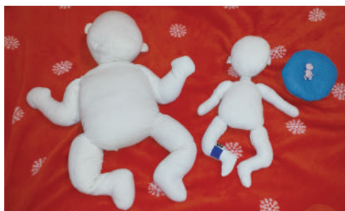
胎児人形を使ってわかりやすくしています！

教材を使って男性・女性の体の変化を表したり、妊娠3か月・5か月・8か月の胎児人形を使ってお腹の中の赤ちゃんの様子を伝えたりしています。