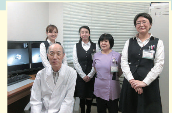
私たちが伺います

特に、障がい者施設利用者の方への健康診断は、三条市内のほとんどを当院で行っており、スタッフが検診車で各施設へ伺います。また、利用者の方が安心して健診を受けられるように、障がいの特性を理解し、和やかな雰囲気を作るように努めています。