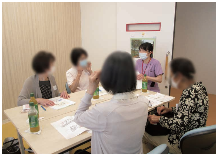
話すほどに元気になります

これからも家族の支援にも光を当て、地域のお役に立っていきたいと考えております。どうかよろしく願いいたします。