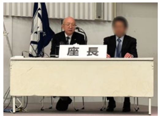
左側が当院の技師長です

当日は1,000名を超える臨床検査技師、関係者、臨床検査技師を目指す学生が参集しました。講演やシンポジウム、ワークショップなど、多彩なプログラムがあり、基調講演ではAI技術による臨床検査の変化を取り上げ、多くの参加者が熱心に耳を傾けていました。当院の職員も一般演題で発表し、日頃の臨床での取り組みや研究成果を紹介することで、多くの参加者と意見交換を行い、貴重な学びの機会を得ることができました。