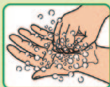
⑦ 指先でもう片方の 手の平でもみ洗う (両手)