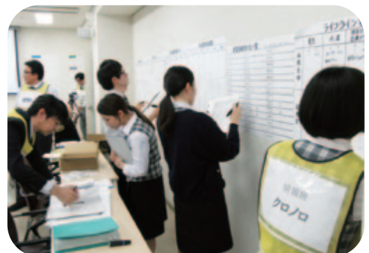
災害対策本部：病院の被災状況を掲示・共有