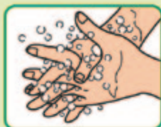
⑤ 指を組んで両手の 指の間をもみ洗う