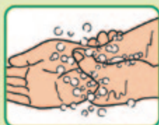
⑧ 両手首まで ていねいにもみ洗う