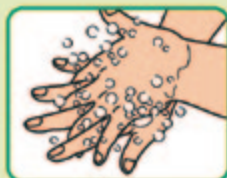
④ 手の甲をもう片方の 手の平でもみ洗う (両手)