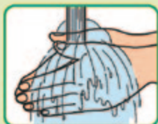
① まず手指を 流水でぬらす