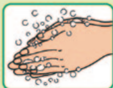
③ 手の平と手の平を 擦り合わせ よく泡立てる