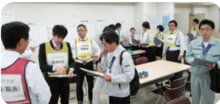
災害対策本部：保健所連絡担当者との打合せ

※1 トリアージ：大事故・災害などで同時に多数の患者が出た時に、手当ての緊急度に従って優先順をつけること。