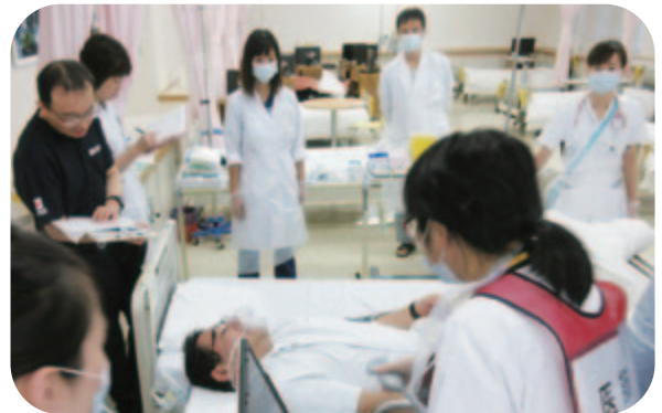
治療エリアでの対応(トリアージ分類:赤)

当院は新潟県から災害拠点病院に指定されています。災害医療派遣チーム(DMA T)も有しており、毎年この時期に災害時における傷病者の受け入れや情報の共有、転院搬送などの大規模な訓練を実施しています。