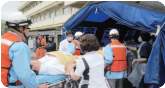
トリアージセンターに傷病者を搬入