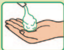
② 泡状の石けん液を 適量手の平に取り出す