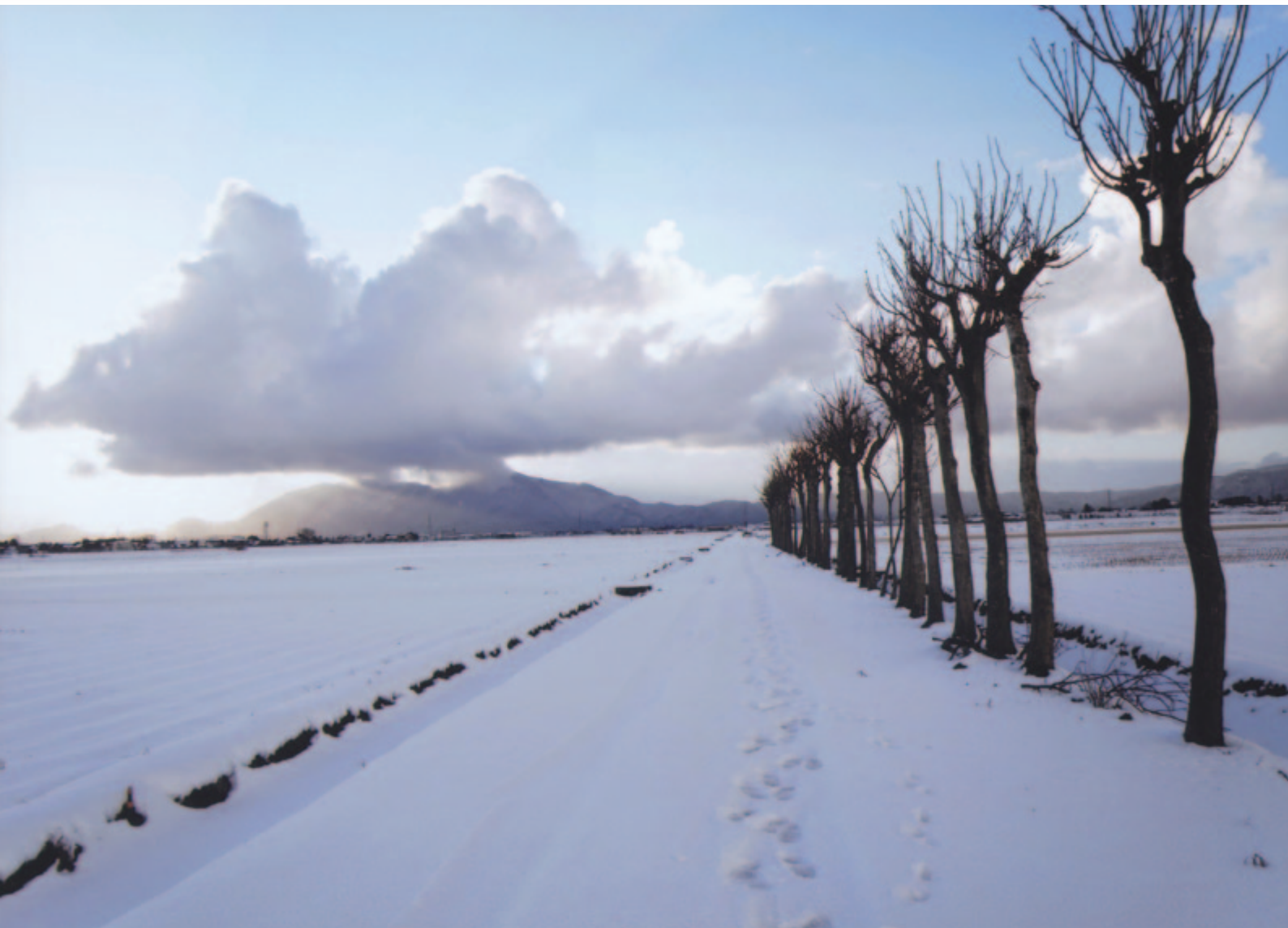
冬の田園 ● 撮影 山田 健一 氏