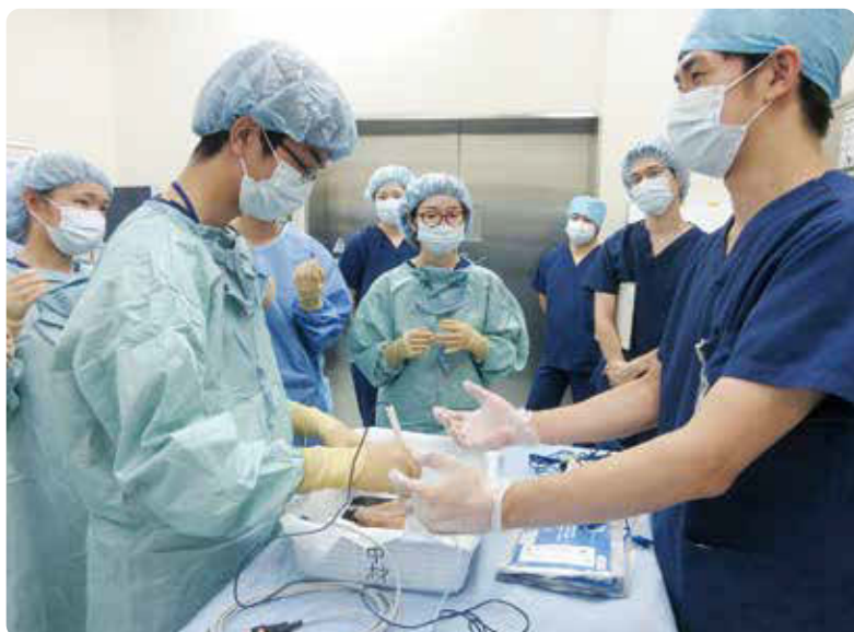
電気メスによる模擬手術体験

当日は挨拶・郷院長の講話・オリエンテーションの後 手術室・放射線科を廻っての見学体験と講義室で心肺蘇生法の実技をしていただきました。