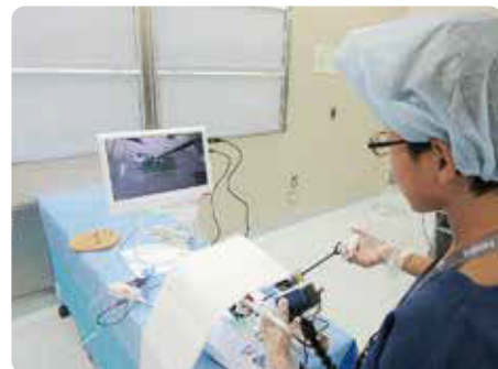
モニターを見ながらの腹腔鏡操作