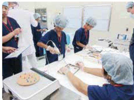
超音波メスでの模擬手術体験