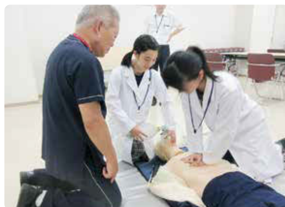
指導を受けながら心臓マッサージの実習