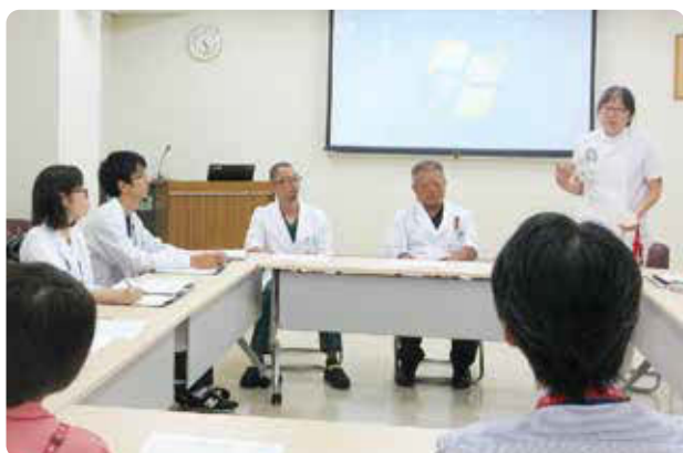
当院医師との交流会の様

これからも地域医療のために活動を続けてまいりますので、よろしくお願いいたします。